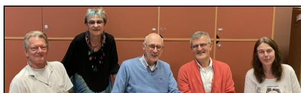
Het bestuur: links tijdens de ALV in februari, rechts tijdens de extra ALV in mei.