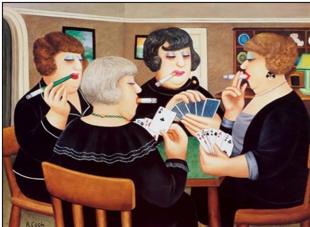
Beryl Cook: Bridge party

We hebben het initiatief genomen om - samen met de andere NBB-clubs - op zaterdag 8 maart de eerste Delftse Dames Drive te organiseren. Dit ter gelegenheid van de internationale vrouwendag. We gaan er een gezellige middag van te maken, en hopen op een mooie opkomst.